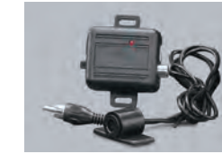
506T ガラス割リセンサ