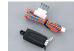
507M デジタルチルトセンサ

ジャッキアップによる車両の持ち上げや、積載での盗難に対する角度検知センサです。ホイールの盗難にも有効です。