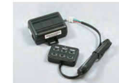
103T キーパッド式イモビライザー

暗証番号入力タイプのイモビライザーです。正しい暗証番号を入力しないとイモビライザー機能が働き、エンジンの始動ができません。