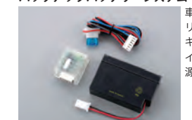
520T バックアップバッテリーシステム

車両のメインバッテリーを外されても、セキュリティシステムやイモビライザーへの電源を供給し続けます。