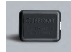
905311 プロキシミティセンサ

ジャッキアップによる車両の持ち上げや、積載での盗難に対する角度検知センサです。ホイールの盗難にも有効です。