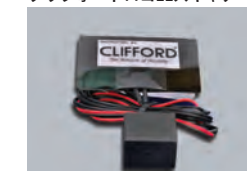
620C クリフォードロゴELスキャナー

ボタン式エンジン始動車両専用スターターモジュール。リモコンの遠隔操作により、車両のエンジン始動ができます。