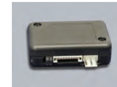
KL301 プッシュスターターモジュール

ボタン式エンジン始動専用スターターモジュール。リモコンの遠隔操作により、車両のエンジン始動ができます。