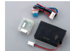
520T バックアップバッテリーシステム

車両のメインバッテリーを外されても、セキュリティシステムやイモビライザーへの電源を供給し続けます。