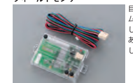
508D フィールドセンサ

目に見えない保護ドームを車両周辺に構築し、エリア内に侵入があれば警告または警報を発生します。