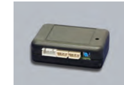
KL505 スマートコントロールアダプタ

純正キーレスやスマートキー、インテリジェントキーなどの最新キーシステムに対応を可能にするアダプタです。純正キーでクリフォードの警戒、解除をコントロール可能。