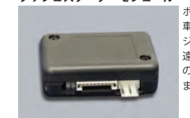
KL301 ブッシュスターターモジュール

ボタン式エンジン始動車両専用スターターモジュール。リモコンの遠隔操作により、車両のエンジン始動ができます。