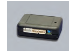
KL777 スマートコントロールアダプタ

純正キーレスやスマートキー、インテリジェントキーなどの最新キーシステムに対応を可能にするアダプタです。純正キーでクリフォードの警戒、解除をコントロール可能。