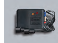
509U ウルトラソニックセンサ