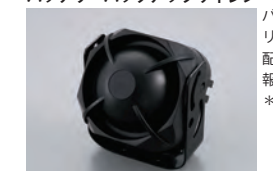
515型 バッテリーバックアップサイレン

バックアップバッテリー内蔵のサイレン。配線を切断されても警報音を発します。*S330は非対応