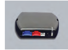
DBALL2 クリフォードCAN-BUSアダプタ

純正キーレスやスマートキー、インテリジェントキーなどの最新キーシステムに対応を可能にするアダプタです。純正キーでクリフォードの警戒、解除をコントロール可能。