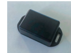
RU101 追加イモビライザ