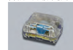
504D ダブルゾーンショックセンサ