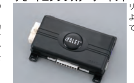
561C リモートエンジンスターターキット

暗証番号入力タイプのイモビライザーです。正しい暗証番号を入力しないとイモビライザー機能が働き、エンジンの始動ができません。