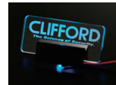
AT-APC2 イルミネーションロゴスキャナー