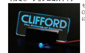
AT-APC2 イルミネーションロゴスキャナー