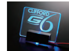
AT-APG6 イルミネーションロゴスキャナー