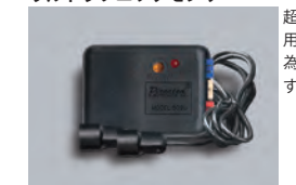
509U ウルトラソニックセンサ