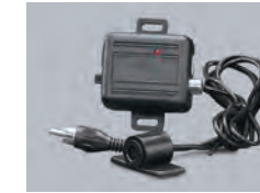
506T ガラス割リセンサ