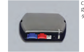
DBALL2 クリフォードCAN-BUSアダプタ

純正キーレスやスマートキー、インテリジェントキーなどの最新キーシステムに対応を可能にするアダプタです。純正キーでクリフォードの警戒、解除をコントロール可能。