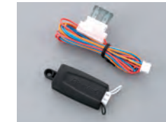
507M デジタルチルトセンサ

ジャッキアップによる車両の持ち上げや、積載での盗難に対する角度検知センサです。ホイールの盗難にも有効です。