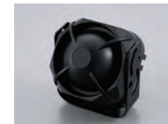
515型 スマートセルフパワードサイレン

ボタン式エンジン始動専用スターターモジュール。リモコンの遠隔操作により、車両のエンジン始動ができます。