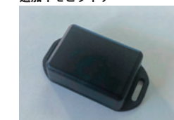
RU101 追加イモビライザー

車両のメインバッテリーを外されても、セキュリティシステムやイモビライザーへの電源を供給し続けます。